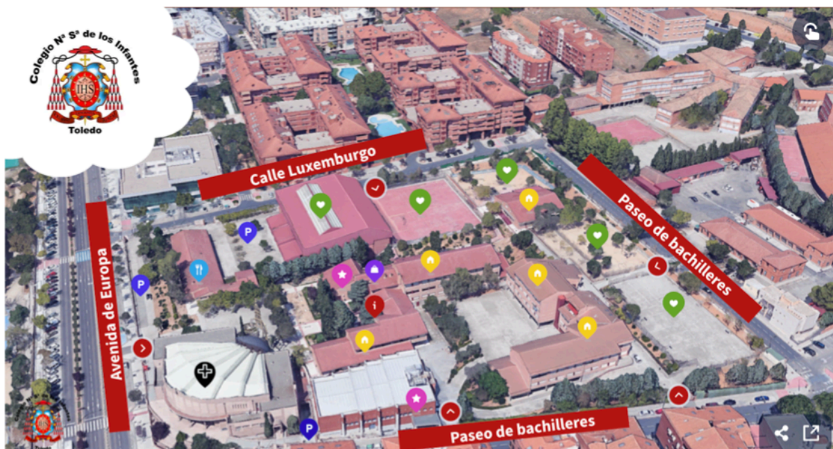
Figura 1: Mapa de distribuciones de las diferentes instalaciones del centro educativo