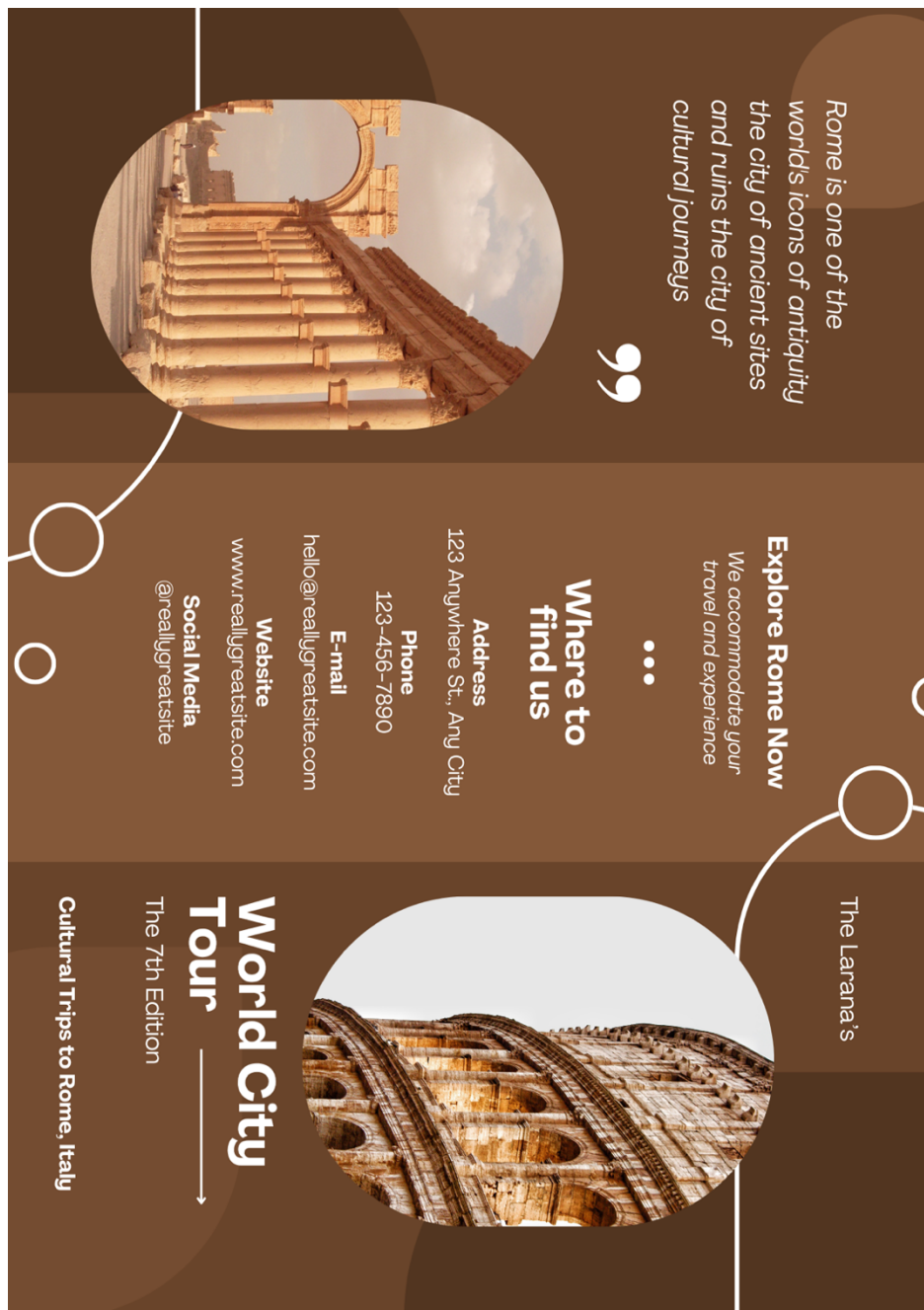
Figura anexada 1.

Nota: Esta imagen se titula “Brown Creative World City Tour Trifold Brochure” de Fannan Studio en la plataforma Canva.