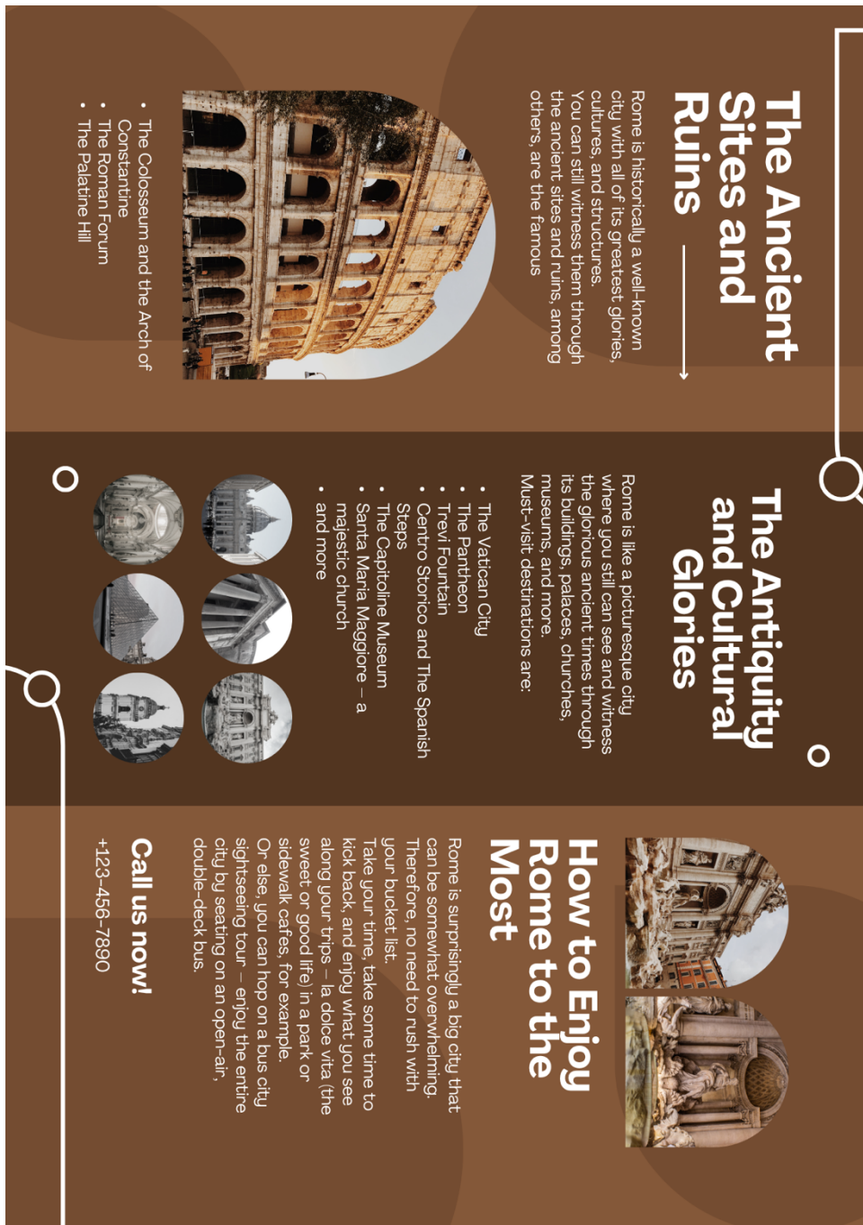
Figura anexada 2.

Nota: Esta imagen también se titula “Brown Creative World City Tour Trifold Brochure”