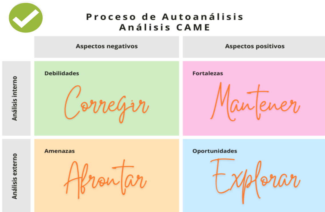
Imagen Plantilla CAME

La última actividad, es la creación de un AVATAR final, es decir, se le vuelve a proporcionar la plantilla a cada alumno para que después de la realización de todas las actividades de cada una de las sesiones, tras haber tenido contacto con empresas y alumnos egresados, tras fomentar el autoconocimiento y la identificación de sus fortalezas y debilidades, en definitiva, haber creado herramientas de reflexión, exploración y conexión con su futuro laboral, realicen de nuevo su AVATAR. Se pretende lograr que el AVATAR final muestre los cambios y el progreso de cada alumno que se ve, con la comparativa del resultado del AVATAR inicial y éste último. Esta actividad será evaluable mediante la rúbrica del apartado 7 del presente proyecto.