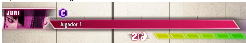
Figura 5 HUD de Street Fighter VI donde se puede ver la vida del personaje y el número de cargas acumuladas de Juri. Captura de pantalla de elaboración propia.

Juri gana una carga cuando ejecuta un cierto ataque especial, representada en el HUD con un símbolo yin yang. Puede guardar hasta 3 cargas. Estas cargas permiten a Juri realizar diversos movimientos como cancelar animaciones, mejorar la potencia o alcance de los movimientos. Los ataques super especiales de Juri también se ven mejorados con estas cargas.