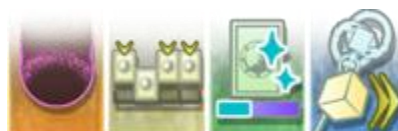
Figura 8 Elemento del HUD de Guilty Gear -STRIVE- que muestra la mano de cartas de Asuka R#.

Asuka utiliza cartas y maná para lanzar hechizos. Durante una ronda, Asuka puede gestionar una mano de 4 cartas que indican los 4 hechizos que puede lanzar. Para usar una carta debe usar una combinación de input con el botón básico correspondiente al hueco en el que está la carta. Para robar carta debe hacerlo con otra combinación de input junto al botón correspondiente. Robar una carta para un hueco que ya tenía carta hace que se descarte esa carta.