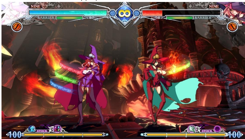
Figura 6 Captura de pantalla de BlazBlue: Central Fiction donde se puede ver a dos Nine con distintos elementos guardados.

Al pulsar el botón de ataques especiales, Nine puede ejecutar hasta 20 hechizos distintos en función de la combinación de elementos que tenga guardada. Cada uno de estos hechizos tiene efectos y propiedades únicos.