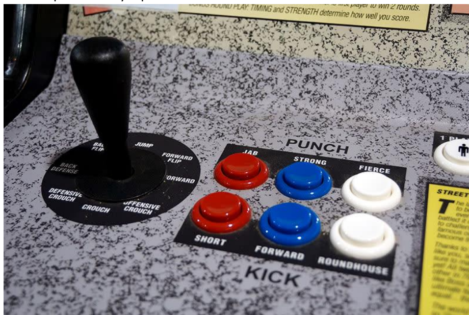
Figura 1 Controles de la versión arcade de Street Fighter II