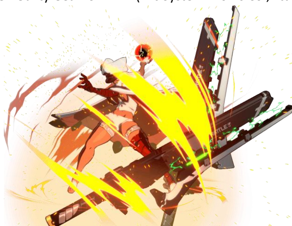
Figura 2 Ramlethal realizando el ataque Mortobato en Guilty Gear -STRIVE-

Estos ataques suelen estar bastante limitados, precisando de inputs difíciles o del uso de recursos importantes como la barra de ataques super especiales. Algunos casos de ataques Reversal serían el Cannon Spike de Cammy en Street Fighter VI (Capcom Co., Ltd., 2023) o el Mortobato de Ramlethal en Guilty Gear -STRIVE- (Arc System Works Co., Ltd., 2021).