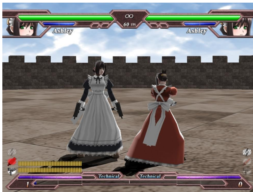
Figura 7 Captura de pantalla de Hinokakera Chaotic Eclipse donde se pueden ver a dos Ashley, una con dos ametralladoras y otra con dos dagas. Captura de pantalla de elaboración propia.