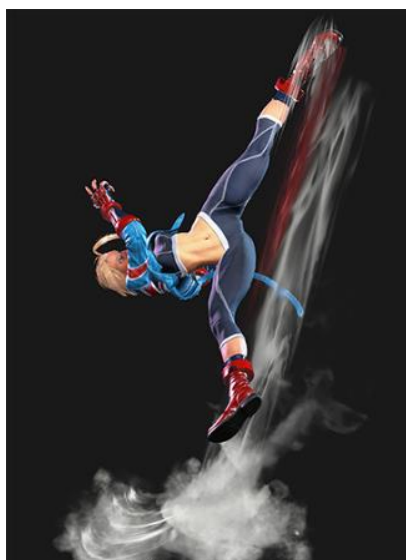
Figura 3 Cammy realizando el ataque Cannon Spike en Street Fighter VI