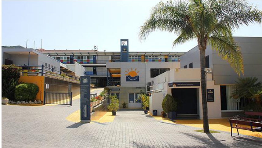
Figura 2: Entrada principal de acceso al Colegio Novaschool Añoreta 4

El recinto, de plano inclinado, se divide en dos zonas en las que se asientan los edificios. En la zona baja hay un lugar para aparcamiento y el acceso principal al centro donde se encuentra el edificio de Servicios Generales y Administración del centro.