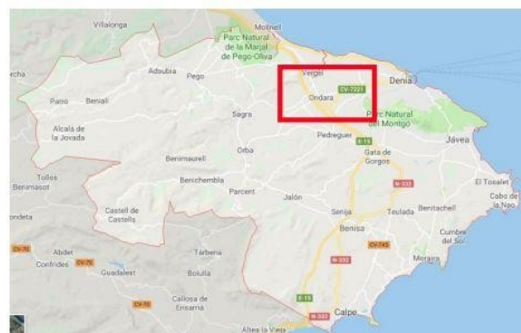
Ilustración 2: La Marina Alta