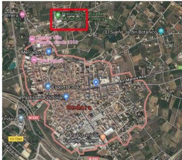
Ilustración 3: Municipio de Ondara