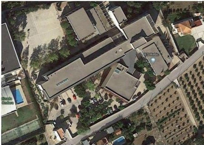
Ilustración 4: I.E.S. Xèbic Ondara (vista desde arriba)