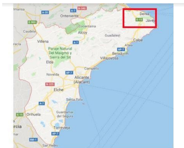
Ilustración 1: Provincia de Alicante